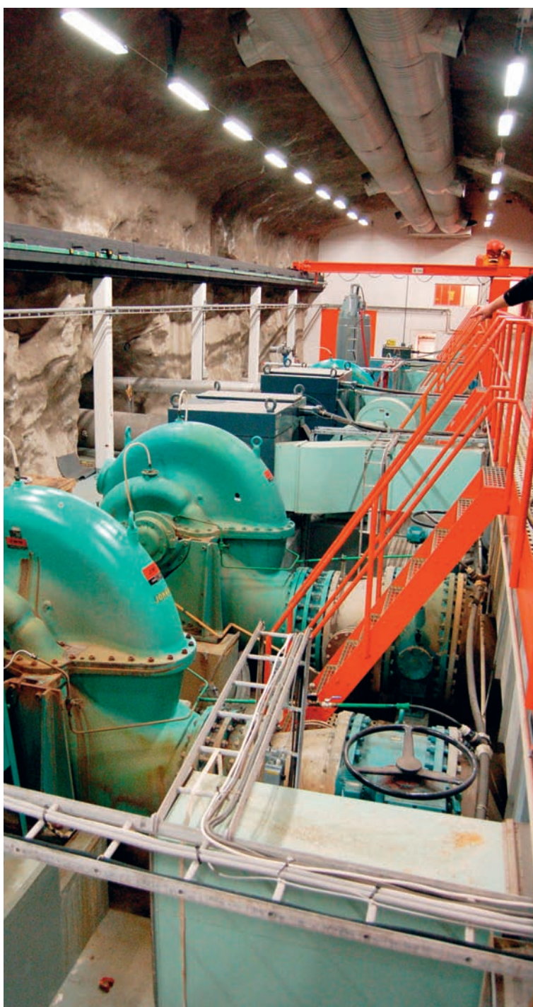
I berggrummet 54 meter under Himmerfjärdsverket finns en pumpstation med sex stora pumpar.

Spångs ProcessTeknik i Tullinge har under lång tid arbetat med uppgradering och renovering av roterande utrustningar som pumpar och fläktar och så vidare. Uppgraderingarna består främst i att invändigt belägga pumpar och fläktar med kompositmaterial.