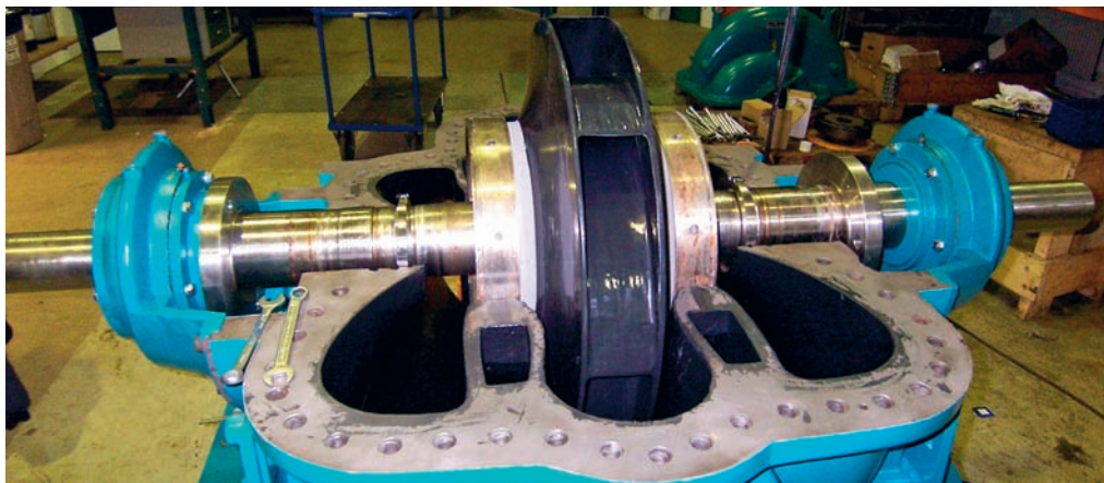
Pumphjulet i en av de uppgraderade pumparna efter kompositbeläggning.

– Kompositbeläggningen i sig sänker kanske ener-